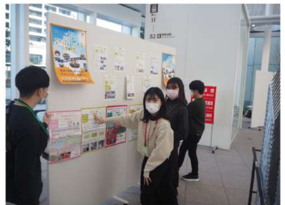
二次審査会場にてパネル展示の上、冊子としても参加者に配布しました